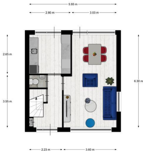
BEGANE GROND, PEELLANDSTRAAT 11 TE LIEMPDE

De plattegronden zijn geschikt voor promotionele doeleinden. Er kunnen geen rechten aan ontleend worden.