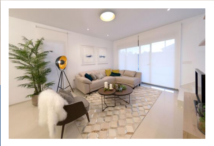
Ruime woonkamer met open keuken